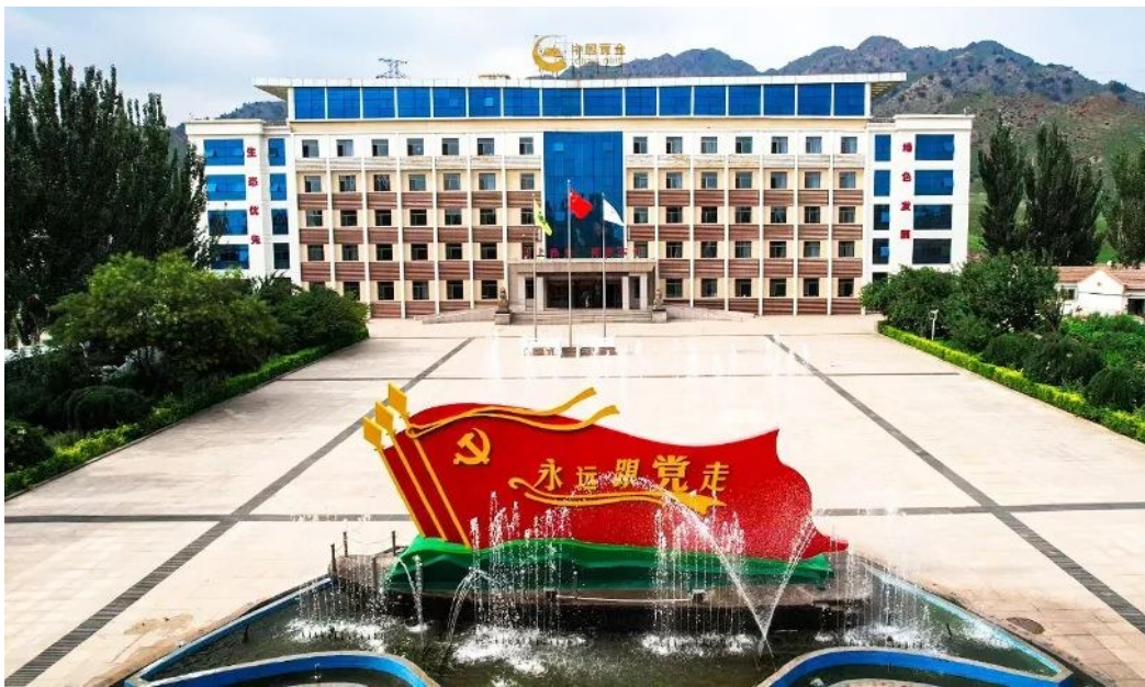
内蒙古包头鑫达黄金矿业有限责任公司

中国黄金集团的诞生和发展带着浓重的红色基因,寄托着党和国家的殷切期盼。党的二十大的胜利召开,必将为中国黄金集团实现跨越式发展,大踏步地赶上时代的潮流提供方向指引。(马春红)