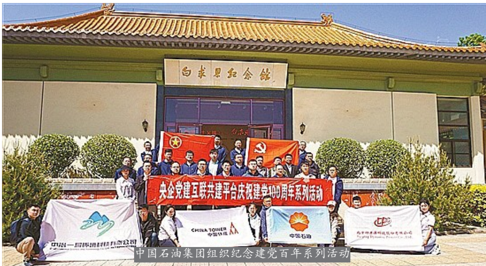
中国石油集团组织纪念建党百年系列活动

100%: 中国石油全面落实管党治党政治责任,加强党员干部教育监督管理,党风廉政建设工作签订率达100%、党风党纪教育覆盖率达100%。