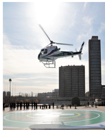
长春高峰论坛暨产博会前直升机在演练

一是通过近年来的招聘引进,协会机关、会办企业、专家机构的人才队伍不断壮大,仅协会机关具有中高级技术职称的就近60人,整体软实力大大增强。二是“三度”即社会知名度、会员认可度、对外诚信度大增。三是品牌数量不断扩大、品牌质量日益提升,其效应正在显现。四是服务业务逐步扩大、服务市场逐步扩大、发展空间越来越大。五是服务项目储备尤其是500万元以上的大项目增多。