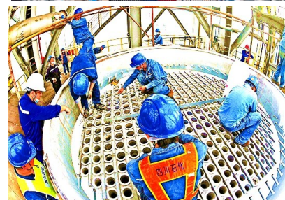
协会专业部门到会员单位及合作项目施工现场进行服务咨询指导