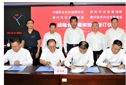
协会与泰州市三部门签战略合作协议

去年是协会对外合作成果最大的一年。一是先后与中安华邦、应急管理大学(筹)、中国华润集团、宏川物流、江苏省泰州市应急局、大庆油田、中国通用集团等单位签订了战略合作协议。二是协会包括分支机构还与相关单位签订了7项专项业务合作协议。三是有些新的合作意向正在协调对接和推进之中。