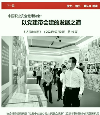
协会党委组织参观“让党放心、让人民满意”2021年新时代中央和国家机关党的建设成就展