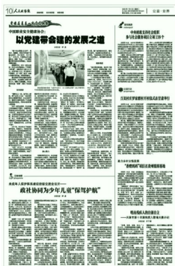
协会党建经验刊登在《人民政协报》上

通过开展各种公益性服务和进行精准技术咨询服务等一系列服务工作,使社会效益大大提升。在此基础上,我们坚持在服务中经营、在经营中服务,使得自身服务总收入突破了1亿元大关,比上年增长近一倍,终结了建会以来服务收入一直在千万元级上徘徊的历史。同时,实现了全年利润目标,达到1457万元,收入、效益均创出历史最好水平。