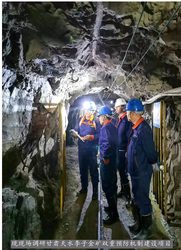
现场调研甘肃天水李子金矿双重预防机制建设项目

一是积极创建有特色的部门业务服务品牌,在双重预防机制建设、安全隐患排查、钢铁行业相关方管理提升等方面进行了尝试。编制《双重预防机制运行诊断(评估)及提升实施方案》,并实