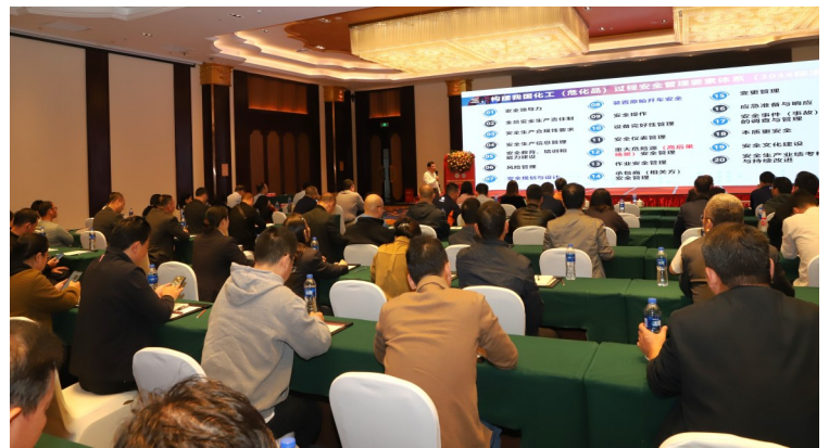
化工过程安全专题研讨会