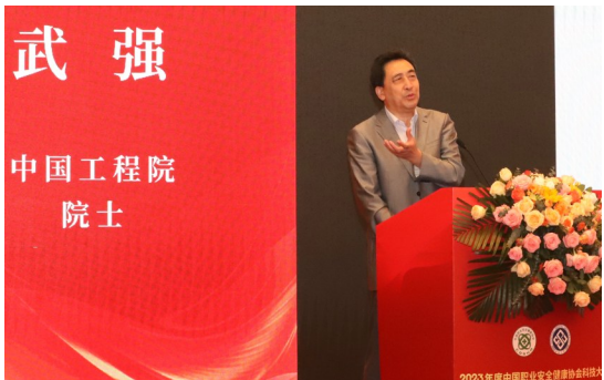
中国工程院院士武强在大会作主旨演讲