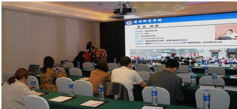
安全科学与工程博士学术专题研讨会