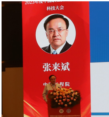
中国工程院院士张来斌在大会作主旨演讲