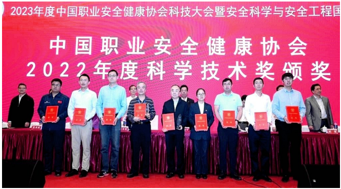
为2022年度科学技术奖获得者颁发获奖证书

——2023年度中国职业安全健康协会科技大会暨安全科学与安全工程国际会议暨安全科学与安全工程国际会议会场内外