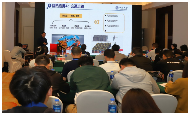
交通安全与智能建造专题研讨会