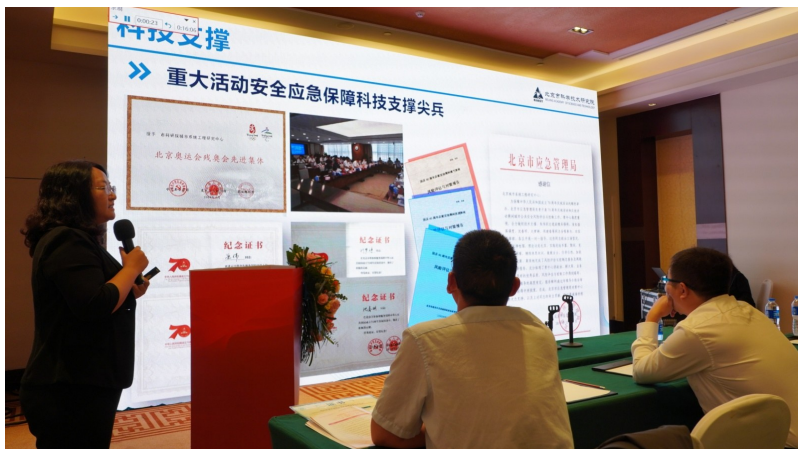
科研管理工作专题研讨会