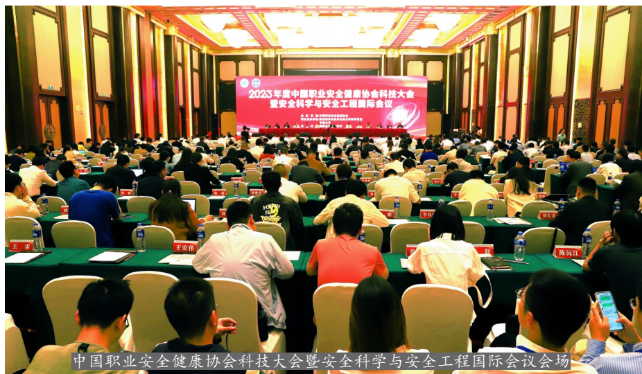
中国职业安全健康协会科技大会暨安全科学与安全工程国际会议会场

10月19日-20日,2023年度中国职业安全健康协会科技大会暨安全科学与安全工程国际会议在湖南省长沙市隆重召开。来自全国安全生产、职业健康、应急管理领域的院士、专家学者、科技工作者、协会会员单位及相关企业代表450余人现场参会,在线参会人数逾10万人。