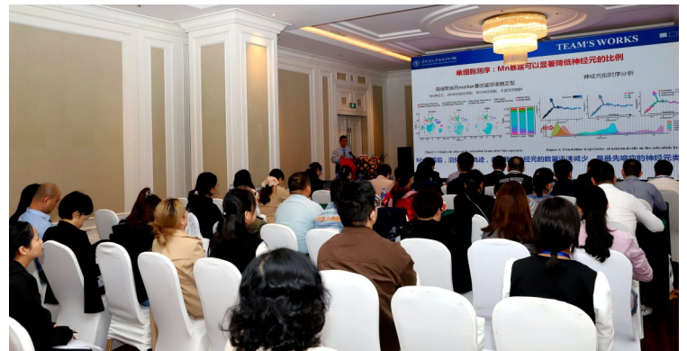
职业健康与健康企业专题研讨会