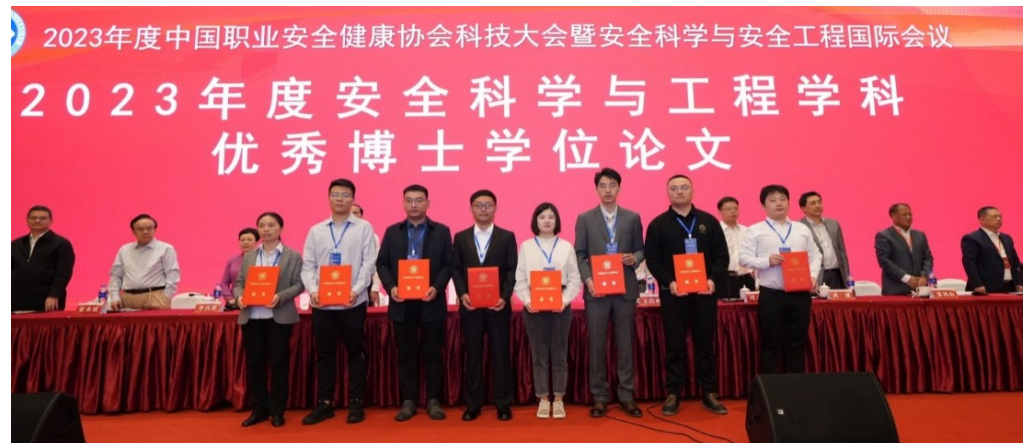
为2023年度安全科学与工程学科优秀博士学位论文颁发获奖证书