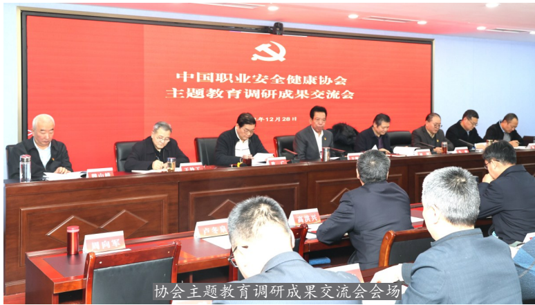
协会主题教育调研成果交流会会场

一个新的起点。要按照中央和中社部对主题教育的要求,切实把严和实的要求贯穿主题教育全过程。要突出成果运用,把总结经验、提炼做法、固化转化贯穿调查研究全过程。要在初步调研成果的基础上深度梳理挖掘,及时向上级部门反映亟须加以推动解决的意见及建议,同时及时找到帮助会员单位破解难题的实招硬招新招,也为协会工作高质量发展提供科学对策。