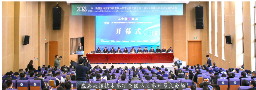
应急救援技术赛项全国总决赛开幕式会场

优秀资源,在提升防灾减灾救灾和安全生产应急救援能力等方面建立共同参与、共建共享的融合机制。二是要用好赛事成果,以点带面,助力安全应急事业发展。作为金砖大赛舞台上首个以安全为主题的技能赛项,要更加精准聚焦矿山领域、工贸行业、危险化学品、建筑施工、公共安全等重点行业领域的实训场景,将课堂上的理论学习拓展延伸到线下的实操培训及技能竞赛当中,让更多的学员通过真实的事例案例、逼真的工作环境,深度参与到安全生产和应急救援模拟实践中,提高自身本领,为安全生产和应急管理事业高质量发展做出努力。三是要坚持以赛促干,强化带动,助力安全应急人才培养。(下转第四版)