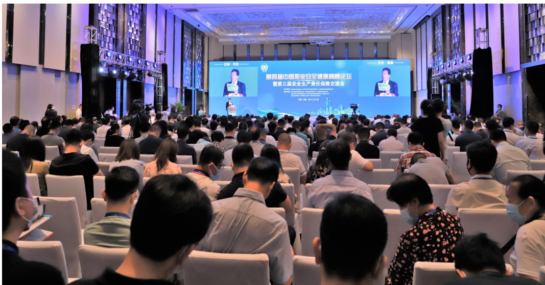
第四届中国职业安全健康高峰论坛暨第三届安全生产责任保险交流会会场

本次论坛由中国交通建设集团有限公司、中国铁建股份有限公司、广基宏源投资有限公司、吉林省天地人环保服务有限公司、福建大东海实业集团有限公司、安徽理工大学、中国交通运输协会、中国煤炭工业协会、中国化学品安全协会协办。来自全国各地各行业的专家学者,协会各分支机构及会员单位代表,高校及科研院所代表,相关政府部门和吉林省、长春市行业企业负责人,新闻媒体记者等六百多人参加了会议。