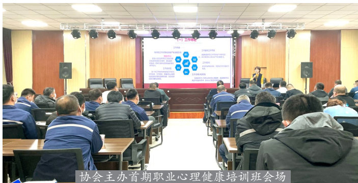
协会主办首期职业心理健康培训班会场

2021年11月23~25日,由中国职业安全健康协会教育培训部主办的首期职业心理健康专题培训班在内蒙古点石沟煤矿隆重