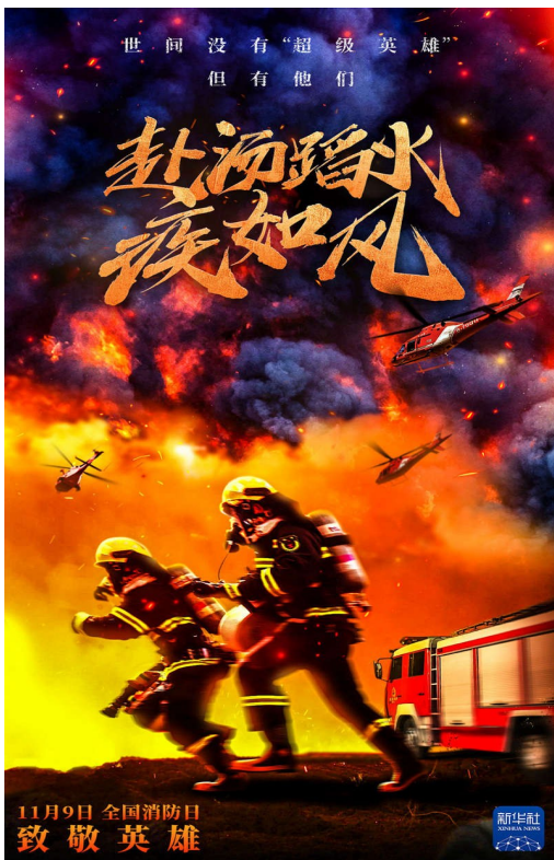
致敬英雄 (全国消防日宣传画)

春光又度， 洒满锦绣路。 凤子龙孙齐腾舞， 敢叫天地翻覆。 一轮红日升腾， 祥云浩荡东风。 天下何处最美？ 笑看中华复兴！