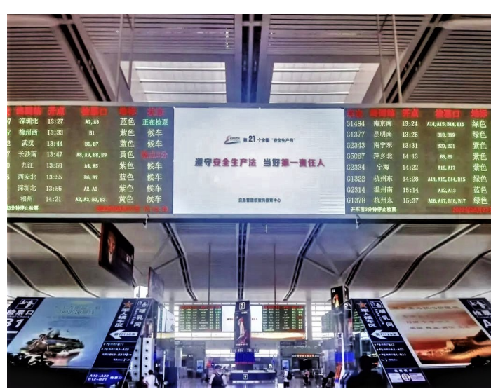
今年全国安全生产月活动的宣传主题走进北京火车站大屏幕