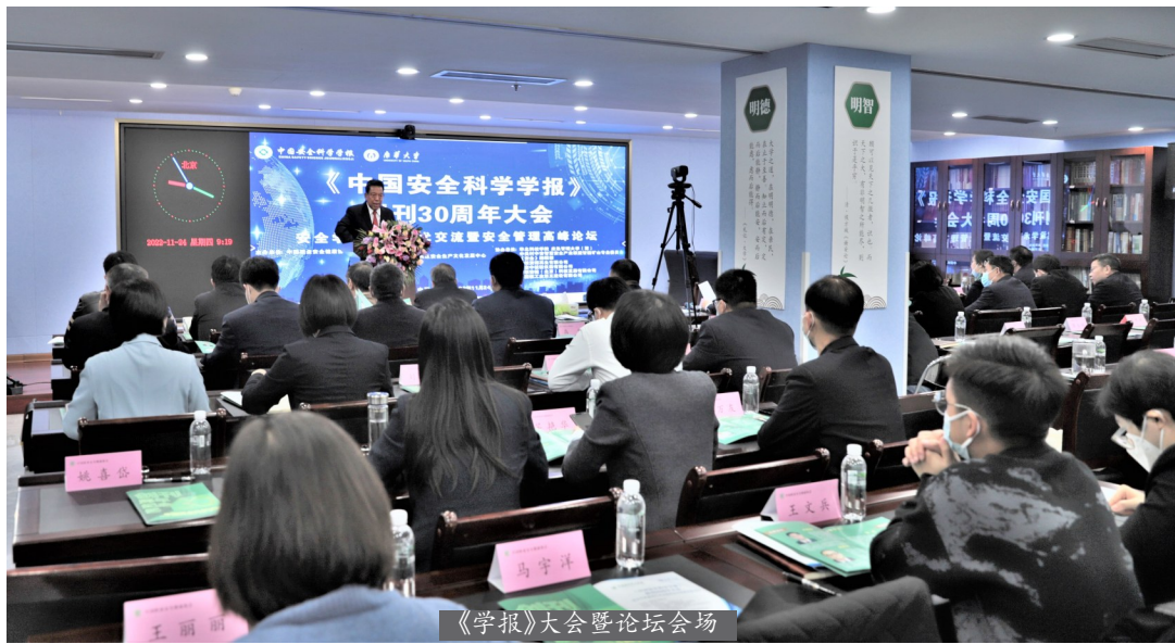
《学报》大会暨论坛会场

11月24日,《中国安全科学学报》(以下简称《学报》)创刊30周年大会、安全学科建设学术交流暨安全管理高峰论坛,以线上线下相结合的方式成功举办。会议由线下北京会场、衡阳会场和线上会场组成。本次大会由中国职业安全健康协会主办、南华大学承办,来自各个安全相关领域的10位中国工程院院士、中国科学院院士,四十多位科研机构、高等院校的专家学者,以及协会、院校的领导和代表参会,热烈庆祝《学报》创刊30周年,畅谈安全学科建设和发展。