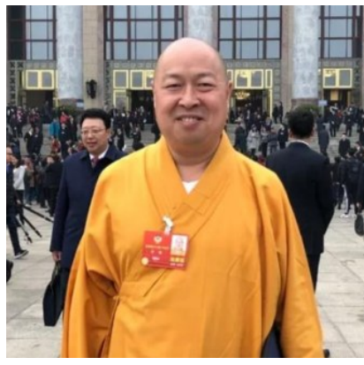
全国政协委员印顺

针对食源性食品安全的重点研究方向,龚卫娟认为,要加快推进食品中食源性生物危害因子识别和形成机制相关研究,加快推进食源性生物危害的风险评估和早期预警体系研究,加快推进食源性生物危害防控关键技术的研发与应用。(文/江迪)