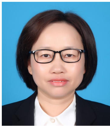
全国政协委员龚卫娟

李全明说,相信随着重大灾害发生机理及预测预报方面的科研攻关,随着先进适用技术装备的推广应用,矿山领域会从根本上遏制重特大事故发生。(文/郭帅)