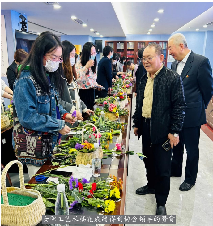
女职工艺术插花成绩得到协会领导的赞赏

一朵朵盛开的鲜花仿佛一张张绽放的笑脸，映衬出协会女职工自信、乐观、积极向上的精神风貌。本次主题活动，女职工们在充分感受节日喜悦的同时，还学习了一门高雅的技艺。大家纷纷表示，今后要更努力创造美好生活，为小家庭幸福出力；更加努力勤奋工作，为协会这个大家庭的跨越式发展做出新的贡献。