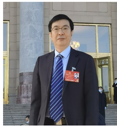
全国政协委员花亚伟

“城镇居民较为突出的三个心理问题,集中表现为强迫症、焦虑及人际关系。此外,家庭暴力,社会戾气,网络暴民现象,包括青少年因学业、成长压力带来的轻生等,时常成为社会关注点。”印顺建议,利用社区已有的服务设施和信息平台等,以创新手段,促进培育民众的心理健康,可以起到促进社会稳定的积极作用。要借助社区直接联系小区、居民的便利,持续不断使科学的心理卫生观念深入人心,将心理保健以科普方式传达给公民。要建立健全社区心理健康服务准则,丰富社区心理健康服务的多样性。同时,还需要广泛借助社会力量,培养专业化社工、义工队伍,探索社区心理健康服务的独特性,从而提升基层社会治理能力和社会化水平。(文/奚冬琪)