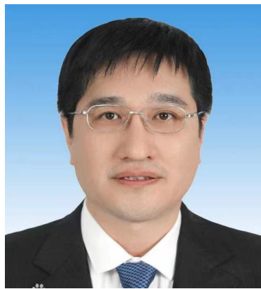
全国政协委员李全明