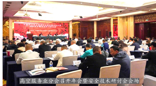
高空服务业分会召开年会暨安全技术研讨会会场

近日,中国职业安全健康协会高空服务业分会2023年年会暨安全技术研讨会在四川南充顺利召开。