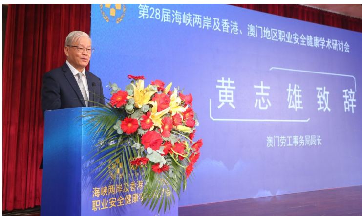
澳门劳工事务局局长黄志雄在大会上致辞

回眸本届学术研讨会，到会进行主旨演讲和专题演讲交流的专家学者、企业代表共42人次，其中中国大陆21人次、港澳台21人次。我们特将与会领导致辞、演讲嘉宾的主旨演讲和专场演讲的主题及演讲风采，以图片掠影的形式予以选登，作为对本届大会的崇高致礼。