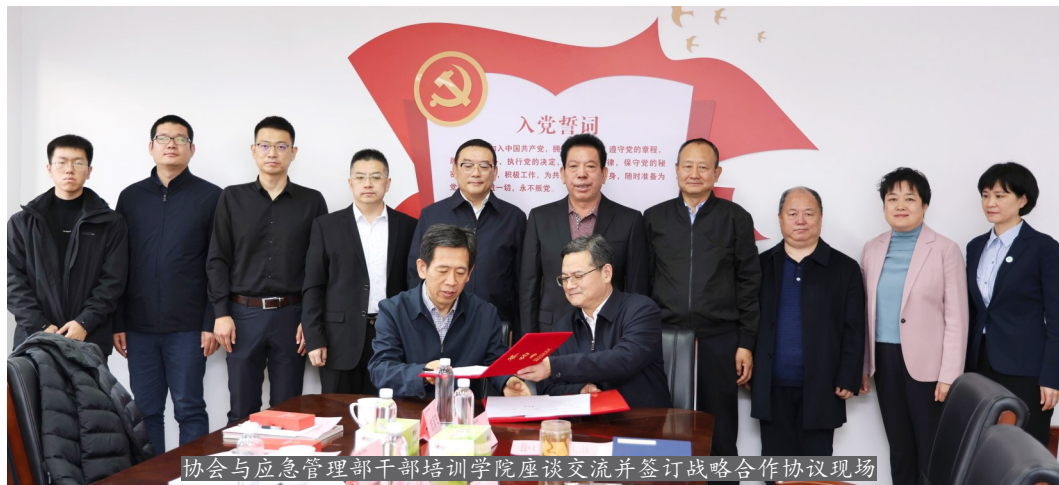
协会与应急管理部干部培训学院座谈交流并签订战略合作协议现场

出,我们院(校)会双方合作有政治基础、思想基础、感情基础、社会基础和历史渊源。我们要精诚合作、相互支持、补短取长。要通过合作,发挥协会优势,使院(校)师资力量加强、社会资源增多;发挥院(校)优势,使协会在教育培训方面有更多的服务机会和服务业务市场,并朝着深度、宽度、广度方向发展。我们要共同努力,使合作愉快、合作成功、合作长远,特别是在教材开发、联合办班等方面,要早找到切入点、尽快打开局面。在基地共建、开发利用上,要探索新路径、务求见实效。