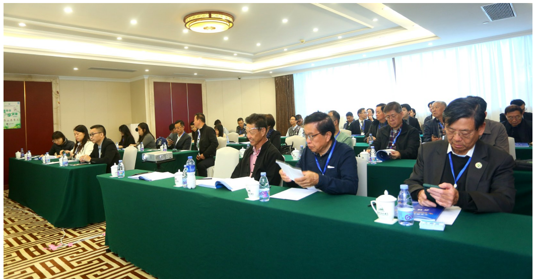
职业健康专场会场